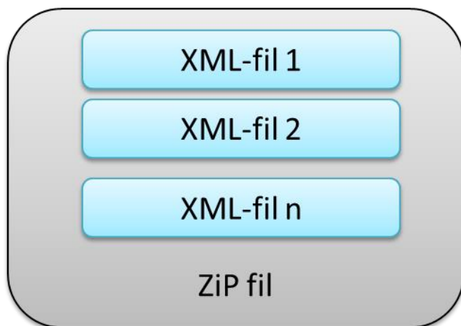
Figur 1: Pakking av (en eller flere) XML filer til en zip-fil

Ved pakking så skal dette utføres i henhold til industristandarden ZIP.