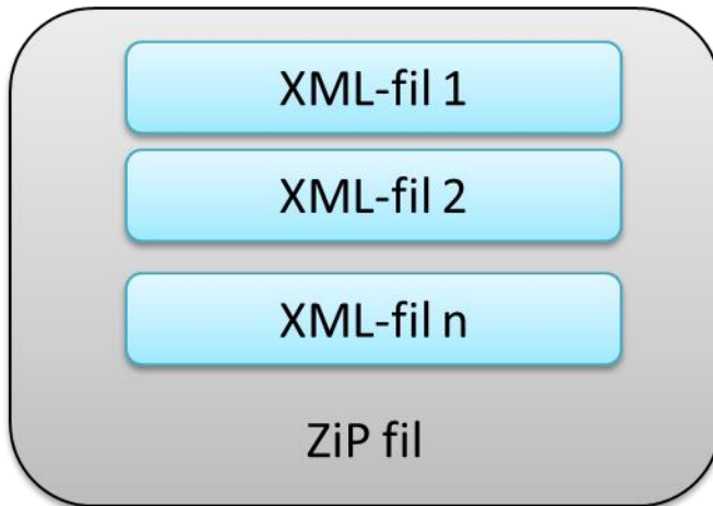
Figur 1: Pakking av (en eller flere) XML filer til en zip-fil

Ved pakking så skal dette utføres i henhold til industristandarden ZIP.